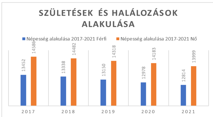
Születések és halálozások alakulása 2017-2021